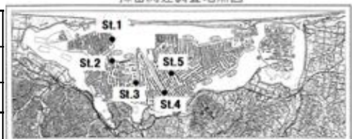
採苗関連調査地点図